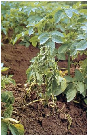
Fot 1 i 2. Wędnące rośliny ziemniaka